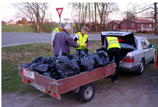
Ja, det ble noen sekker med søppel også denne kvelden.