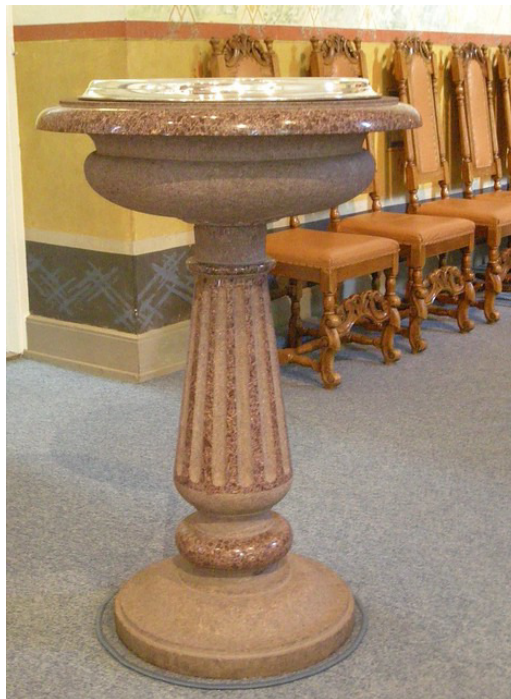
Døpefonten i Hamar domkirke

Takk til mine foreldre og faddere som bar meg til dåpen – og takk til kirken som fortsatt er her. At jeg kan gjøre nytte for meg som kirkemusiker i det samme kirkerommet, er både litt rart og ikke minst fint å tenke på. Det skulle mine foreldre ha visst da de la forholdene til rette med pianoundervisning fra jeg var 5 år og kjøp av et elektronisk orgel av