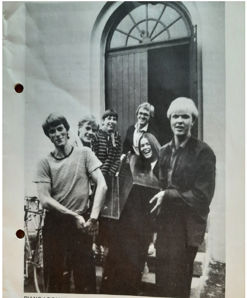
PIANO I DOMKIRKEN?